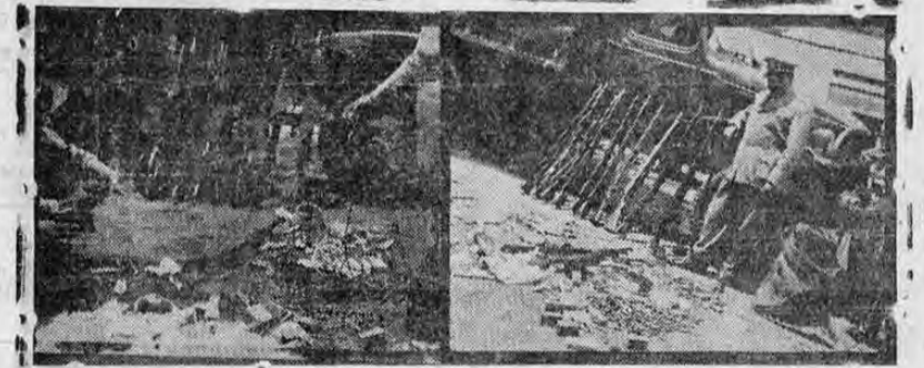
Muestra esta composición gráfica el armamento que fue decomisado, ayer por elementos de la Dirección General de Policía Nacional en acatamiento a órdenes directas impresas por el Coronel don Sigifredo Campos... El armamento que cayó en poder de las autoridades estaba escondido, en dos casas en esta capital, 12 rifles mousery; cinco mil tiros calibre 7 mm; cinco mil tiros calibre 38 corto; más o menos la misma cantidad de tiros 33 largo; salvajes de género manufacturados en el país; tres mil piezas de mecha para bombas explosivas y para dinamita; miles de tiros para ametralladoras Neuhauz, etc.