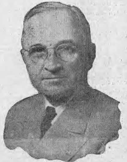
PRESIDENTE HARRY S. TRUMAN